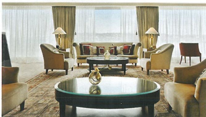
Royal Penthouse Suite - President Wilson Hotel, Ženeva